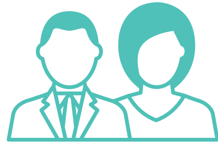
ผู้จัดการ