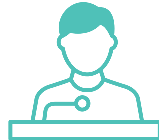
ผู้นำชุมชน

สิ่งที่เรามักจะไม่ ตระหนักก็คือคำพูด และการกระทำของ เราอาจมีแง่มุม ซ่อนเร้นอยู่