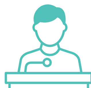
Viongozi wa jumuiya

Sisi mara nyingi hatujui kwamba maneno na matendo yetu yanaweza kubeba ujumbe wa siri