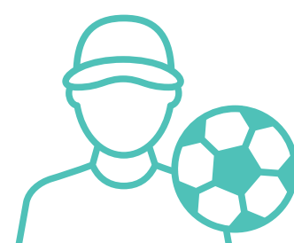
Makocha wa michezo