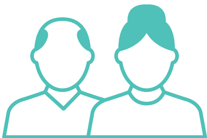
Köcdit ke dhiët ku bäai