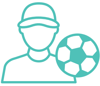
مربی های ورزش