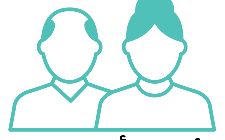
الأجداد وأفراد العائلة